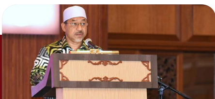
Nilai UMI sentiasa sesuai dengan keperluan semasa — MB Kelantan