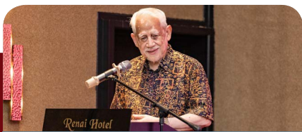
Lensa fotografer antarabangsa pendekatan diplomasi visual Kelantan-Singapura