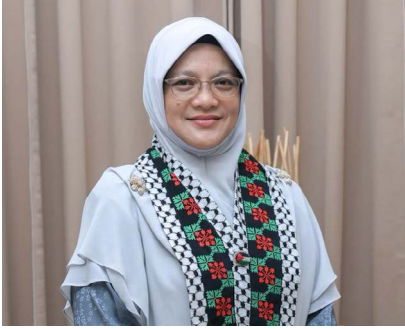
Oleh: Asri Hamat

TUMPAT, 2 Jun - Gangguan operasi feri di Pengkalan Kubor yang didakwa kerap berlaku perlu diberi perhatian serius oleh pihak berkaitan kerana ia membabitkan kehidupan penduduk serta ekonomi kawasan sempadan.