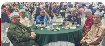
Empat pemimpin Machang santuni 1000 "Anak Mache" di Lembah Klang