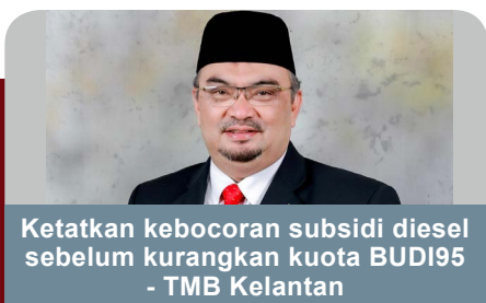
Ketatkan kebocoran subsidi diesel sebelum kurangkan kuota BUDI95 - TMB Kelantan