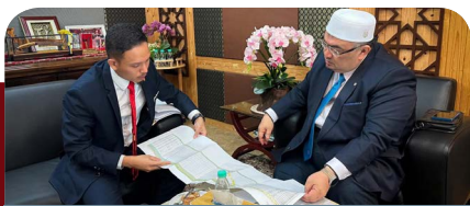
Sumber mineral diceroboh, 58 penguatkuasaan berjaya rampas 42 jentera bernilai RM8.4 juta