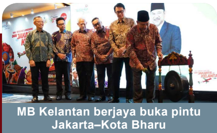
MB Kelantan berjaya buka pintu Jakarta-Kota Bharu