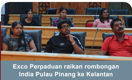
Exco Perpaduan raikan rombongan India Pulau Pinang ke Kelantan