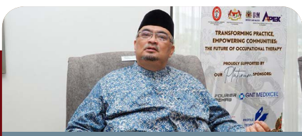
Kerajaan negeri sokong perluasan perkhidmatan terapi cara kerja – TMB