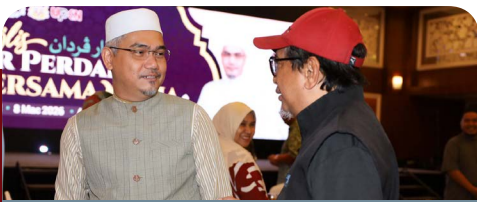
Sidang media pasca Mesyuarat Exco kini amalan tetap – Exco Penerangan