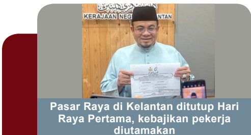
Pasar Raya di Kelantan ditutup Hari Raya Pertama, kebajikan pekerja diutamakan