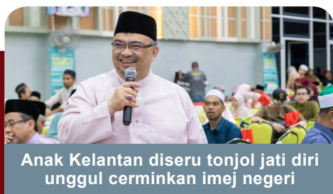
Anak Kelantan diseru tonjol jati diri unggul cerminkan imej negeri