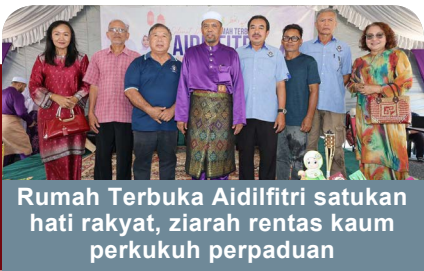
Rumah Terbuka Aidilfitri satukan hati rakyat, ziarah rentas kaum perkukuh perpaduan